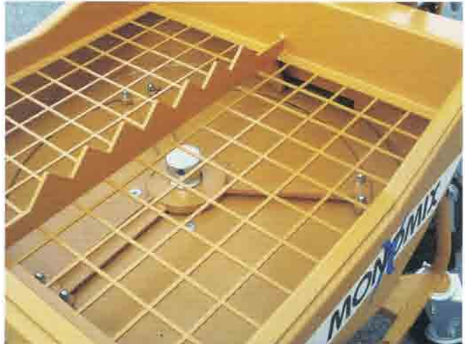
Rueda de rayos para el transporte del material a la cámara de mezcla.

DISPOSITIVO PATENTEADO PARA LA INTERRUPTIÓN AUTOMÁTICA DEL CAUDAL DE AGUA EN LA CÁMARA DE MEZCLA EN CASO DE FALLO TRAS LA PUESTA EN MARCHA DA LA BOMBA DEL MORTERO.