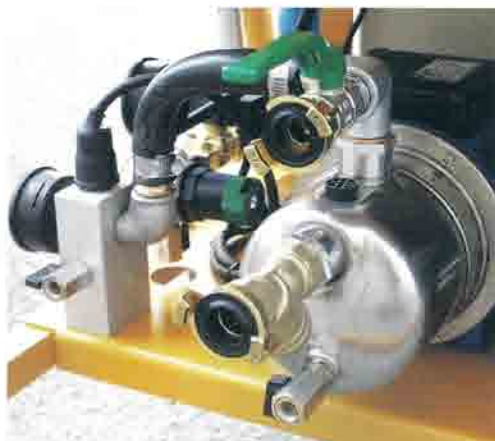
Electrobomba de agua autocebadora.