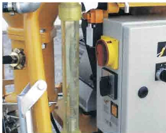
Particular del caudalímetro y sistema de seguridad.