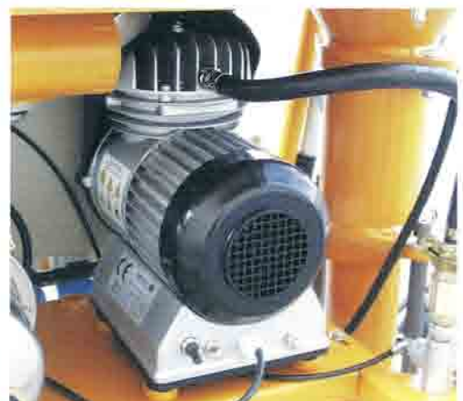
Electrocompresor de membranas en seco.