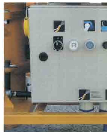
Particular del cuadro eléctrico de control.