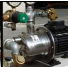
Bomba del agua (versión automática)