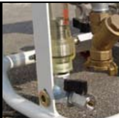
Entrada de agua a la bomba y grifo de regulación en el caudalímetro