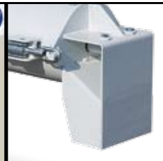
Boquilla de descargo de material con seguridad