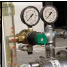
Manómetros para la presión del agua