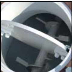
Válvula de mariposa (opcional)